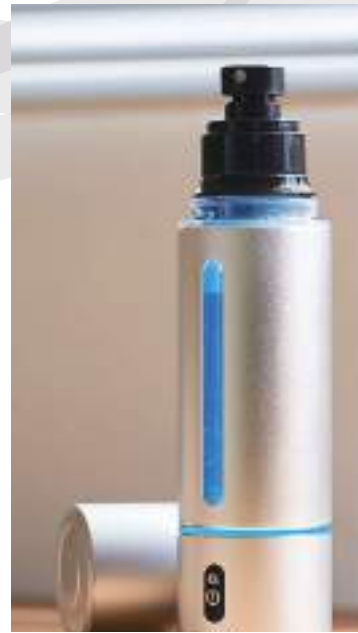
型号: OY-FF60-S 価格 74,800円(税込)

ご自宅やオフィス・外出先など、いつでもどこでも、お手軽にオゾン水を生成でき、消臭・除菌が行えます。