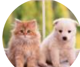
ペット 身の周り用品