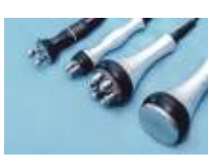
美容院・エステ ネイルサロン器具など