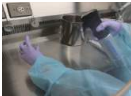
図1. ウイルスを 塗抹させたシャーレに オゾン水の噴霧