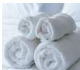
ホテル 他施設など