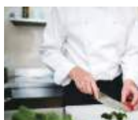
レストラン 厨房器具など