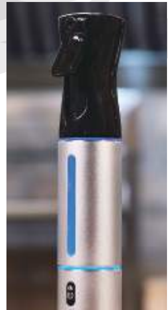
型号: OY-FF62-B 価格 87,780円(税込)

プロ用として、いつでもどこでも、お手軽にオゾン水を生成でき、除菌・消臭にご使用ください。